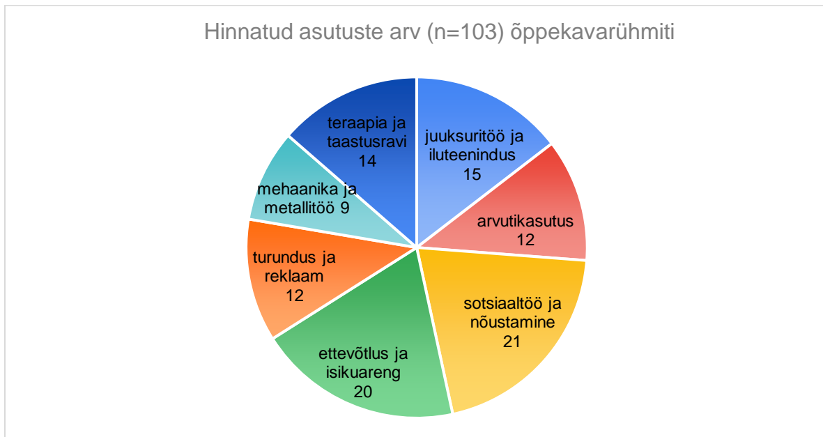
Joonis 1. Hinnatud asutuste arvud õppekavarühmiti.

Märtsiks 2022 on EKKA hinnanud 103 täienduskoolitusasutuse õppe kvaliteeti. Hinnatud õppekavade arv kõikides asutustes kokku on 216. Lähtuvalt töötukassa ettepanekust hinnati asutusi seitsmes õppekavarühmas – ettevõtlus ja isikuareng 1 , sotsiaaltöö ja nõustamine, arvutikasutus, juuksuritöö ja isikuteenindus, teraapia ja taastusravi, mehaanika ja metallitöö ning turundus ja reklaam. Hinnatud asutuste arvud õppekavarühmade lõikes on toodud joonisel 1. Sealt on näha, et enim on hinnatud sotsiaaltöö ja nõustamise ning ettevõtluse ja isikuarengu õppekavarühmades koolitusi pakkuvaid koolitusasutusi.